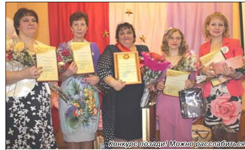
Конкурс позади! Можно расслабиться.