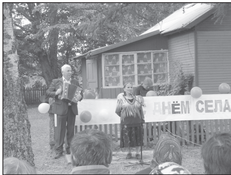
везли артисты Глебенского сельского дома культуры и Ульянинского центра досуга. Жители села и гости с удо-

Самодельные артисты всю старались создать хорошее настроение. Музыкальный подарок при-