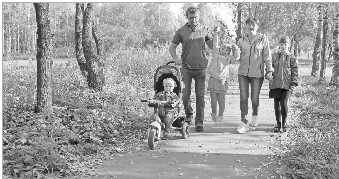
Большая семья – тверская традиция. И эта традиция постепенно возрождается

В абсолютном выражении это прирост в 9,5 тысячи малышей. Сегодня в нашей области почти 237 тысяч детей. Цифры были представлены на заседании регионального правительства, посвященном совершенствованию системы социальной поддержки семей с детьми. Губернатор Игорь Руденя, открывая заседание, напомнил, что всемерная поддержка семьи и укрепление семейных ценностей определены Президентом Российской Федерации Владимиром Путиным ключевой за-