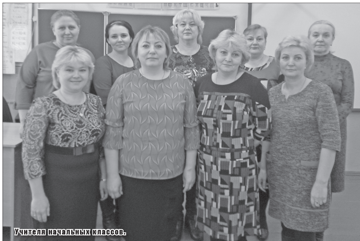
Учителя начальных классов.

заместитель директора по начальным классам средней школы № 2 им. С. Забавина.