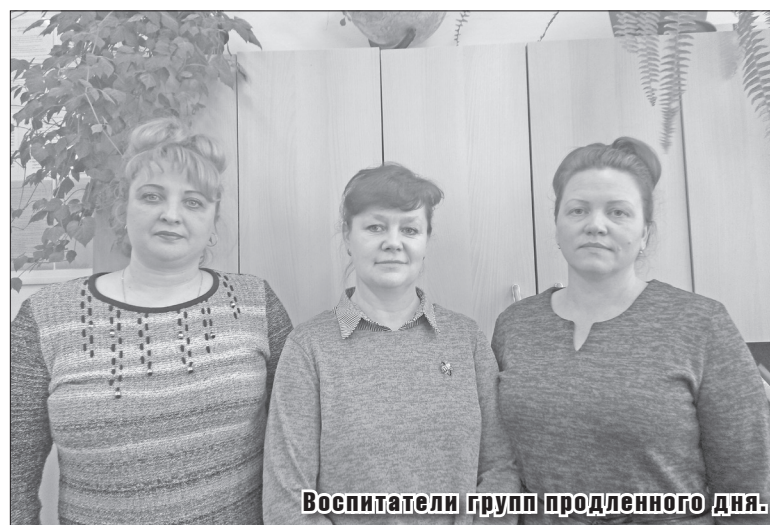
Воспитатели групп продленного дня.