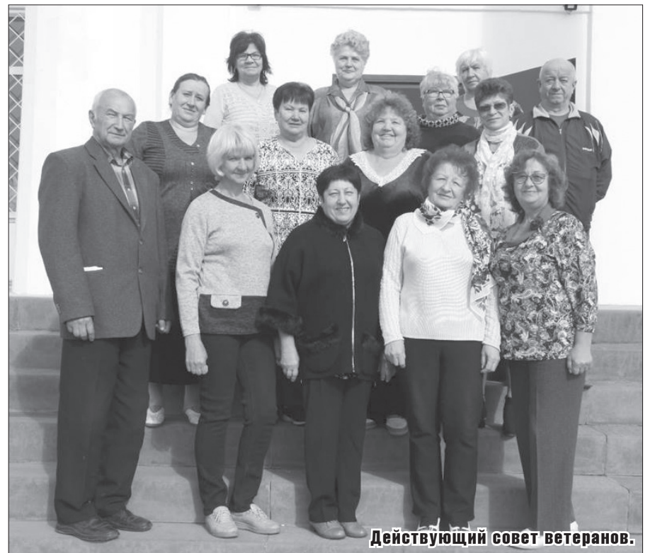
Действующий совет ветеранов.