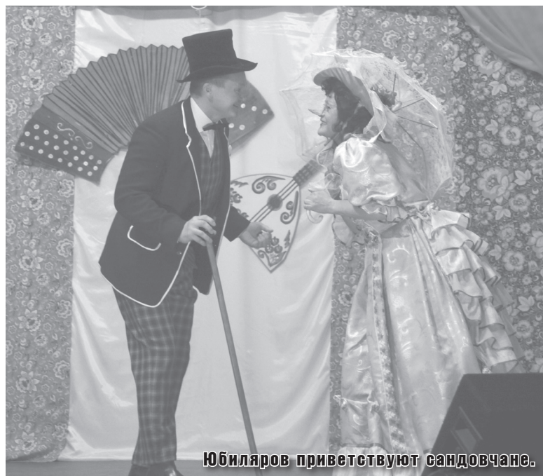
Юбиляров приветствуют сандовчане.