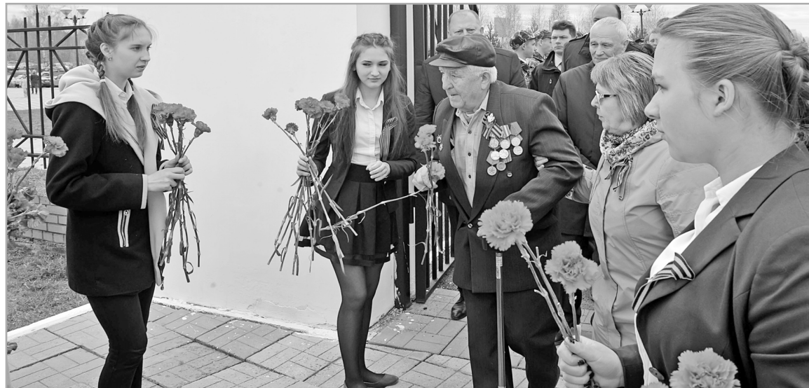
В Верхневолжье реализуется комплекс мер социальной поддержки ветеранов Великой Отечественной войны

В Тверской области в два раза увеличат размер единовременной выплаты ветеранам Великой Отечественной войны