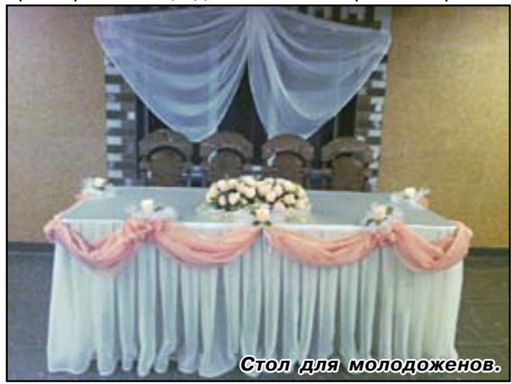
Стол для молодоженов.