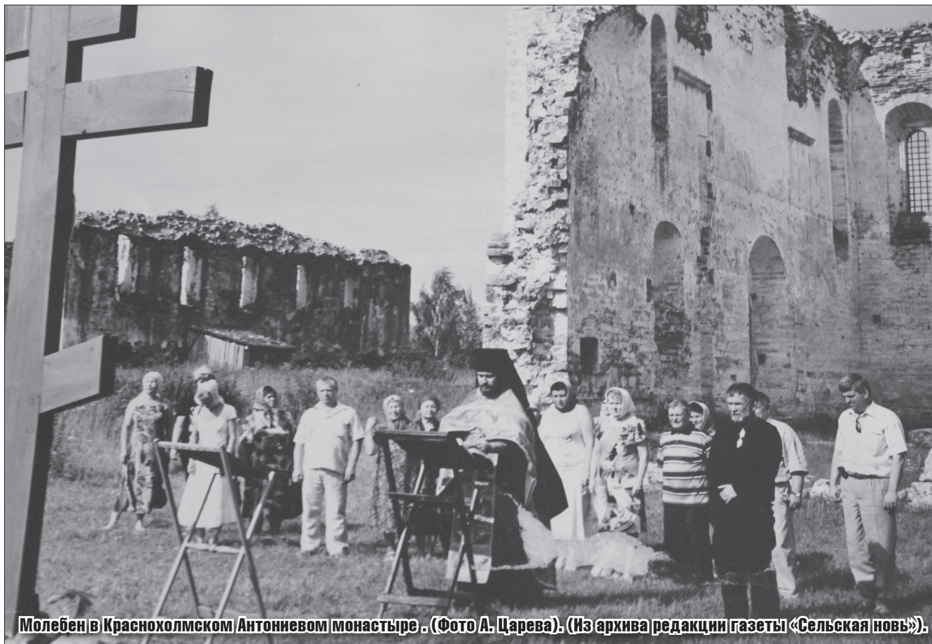
Молебен в Краснохолмском Антониевом монастыре.