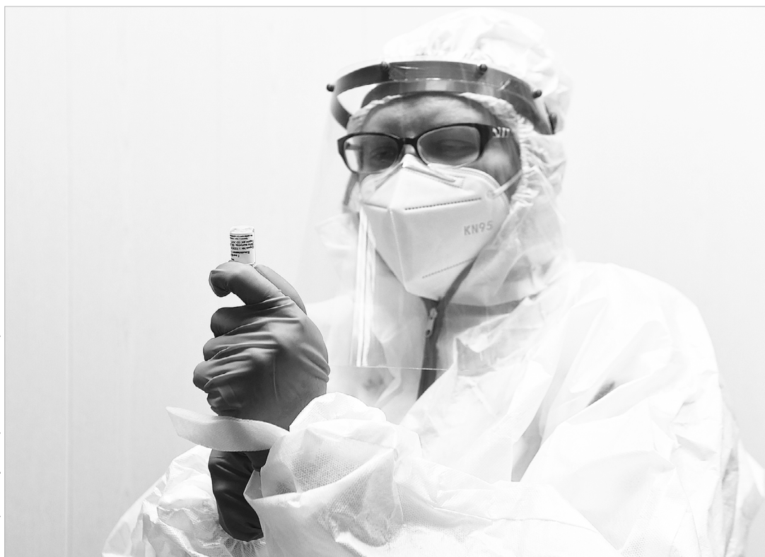
По данным Минздрава, массовая вакцинация от коронавируса ведется препаратом «Спутник V», затем добавится «ЭпиВакКорона» и «КовиВак»