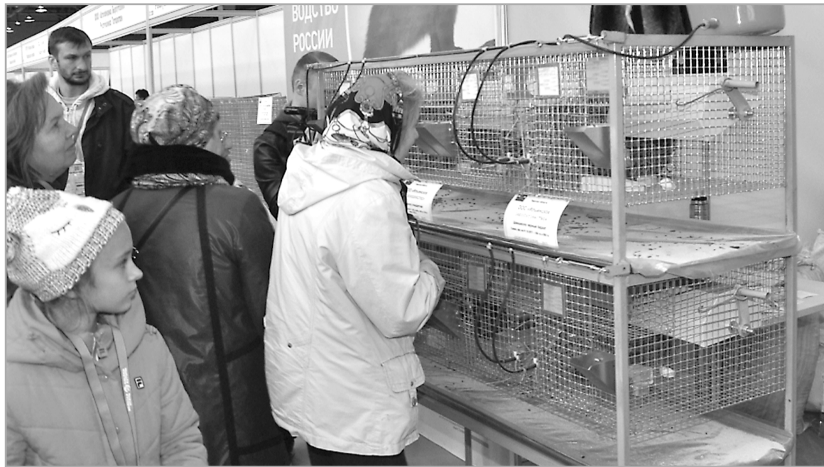
Продукция тверских производителей на выставке привлекала внимание и рядовых посетителей, и экспертов

Некоторые наши сельхозпроизводители представили свои достижения, оформив отдельные площадки. Как, например, ООО «Коралл», животноводческий комплекс которого в Бежецком районе входит в двадцатку крупнейших свиноводческих предприятий России. Зверохозяйства, занимающиеся пушницей, заняли отдельную секцию в павильоне «Животноводство». Здесь можно было увидеть и даже потрогать ценный мех, понаблю-