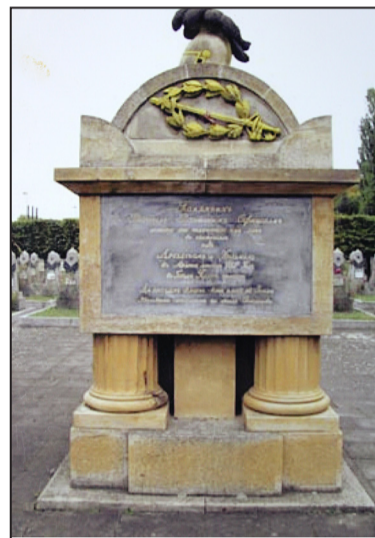
Памятник русским воинам, погибшим в сражении при Кульме.

Видимо после Отечественной войны 1812 года он продолжал военную службу. В