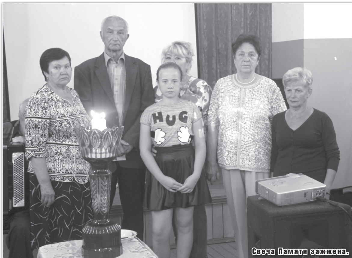
Свеча Памяти зажжена.