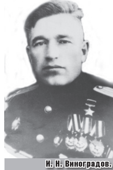
И. Н. Виноградов.