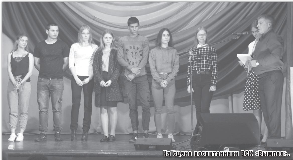
На сцене воспитанники ВСК «Вымпел».

Не обошлось и без областных наград. Благодарности комитета по делам молодежи Тверской области за актив-