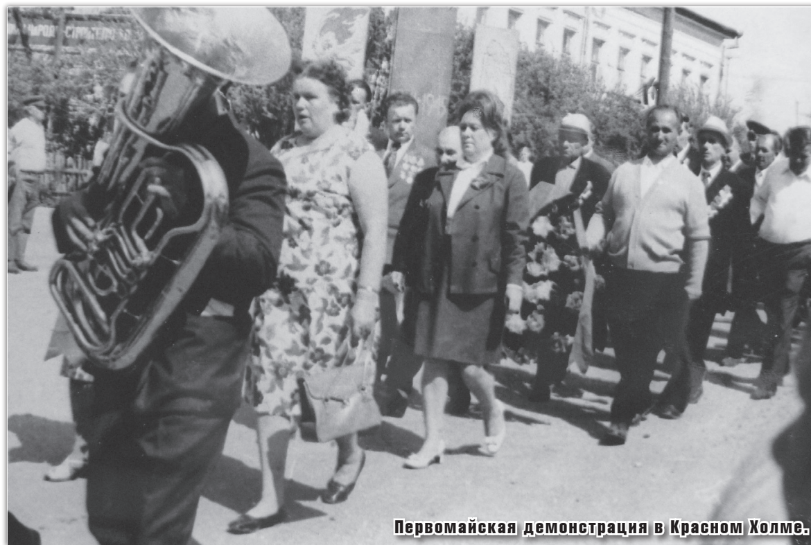
Первомайская демонстрация в Красном Холме.