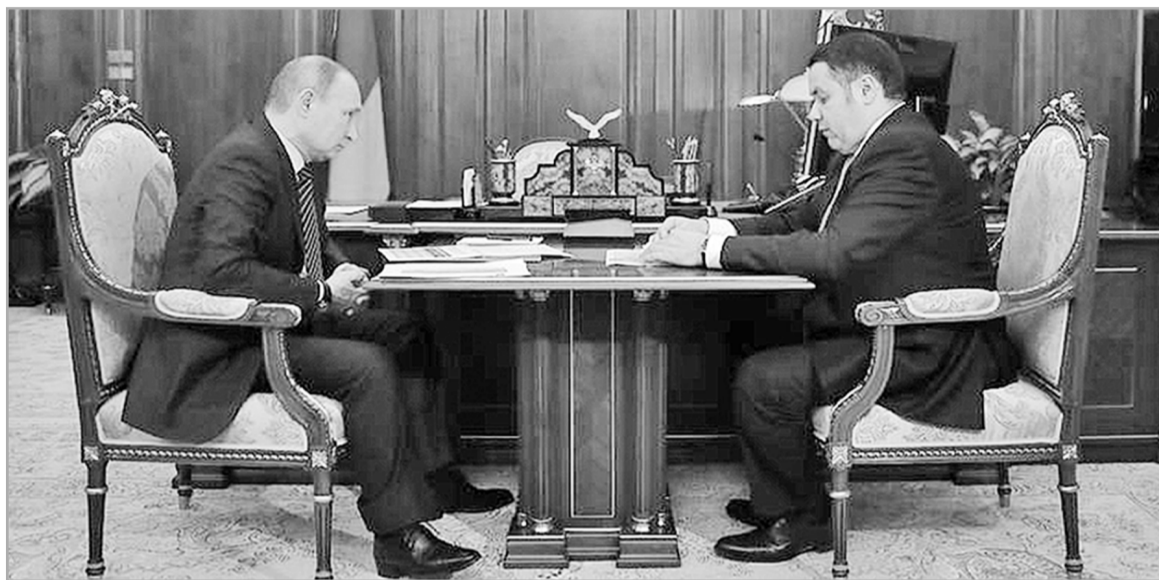
Губернатор Игорь Руденя четвертый раз встречается с Владимиром Путиным

– Круг вопросов, затронутых в беседе с президентом, позволяет предположить, что у Тверской области начинает определяться своя специализация, на которую будет рассчитывать федеральное Правительство, выстраивая прогнозы на средне- и долгосрочную перспективу. Это вагоностроение и связанный с ним кластер промышленных предприятий, а также агропроизводство.