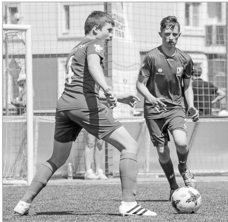
В настоящее время базовыми видами спорта занимаются более 120 тысяч жителей Тверского региона

– Яркая, самоотверженная игра российских футболи-