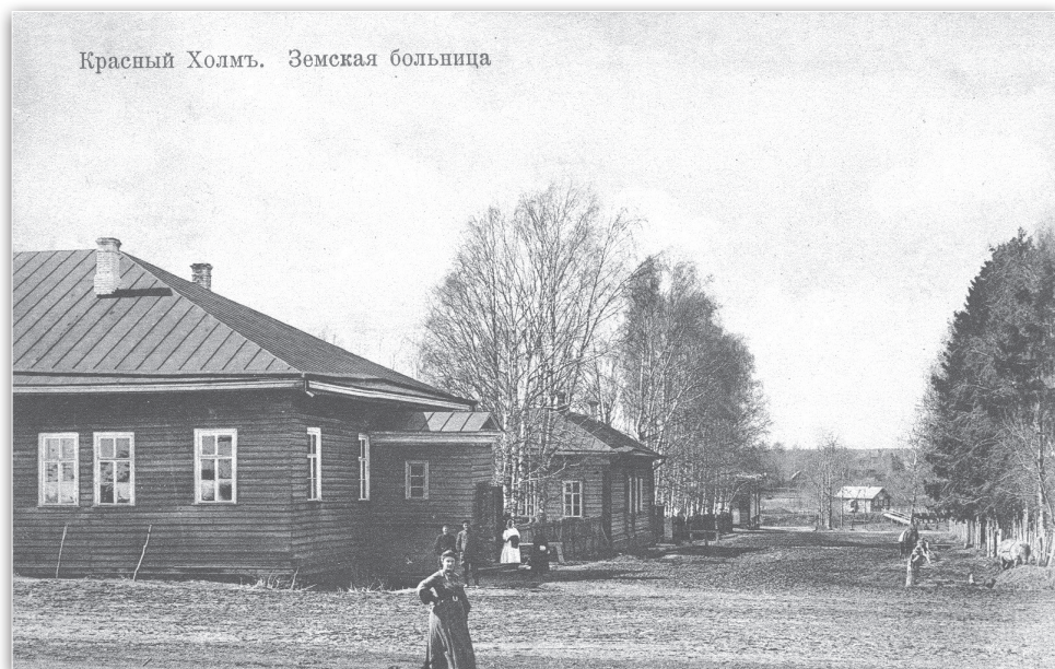
Красный Холмъ. Земская больница