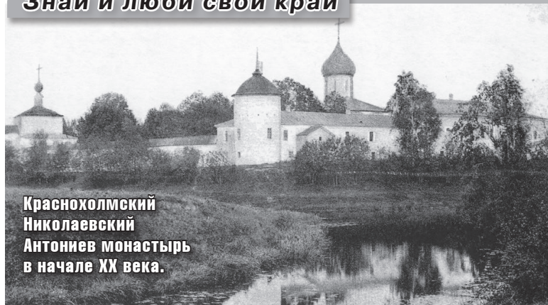
Краснохолмский Николаевский Антониев монастырь в начале XX века.

«В 1518 году июля в 28 день преставился благоверный князь Симеон Иванович Калужский, а дал Николе Чудотворцу в Антониев монастырь в поминовение своей души и своих родителей: после отца своего великого князя Иоанна и после матери своей вотчину в Бежецком верхе село Преображение Спасово на Холмуде село Живоначальной Троицы и деревни...».