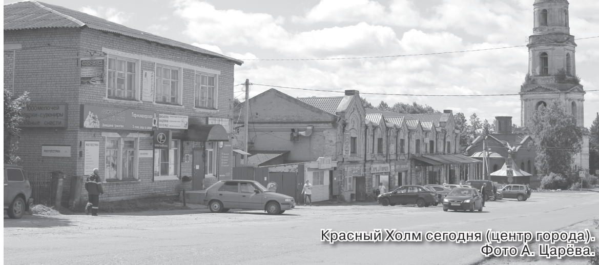
Красный Холм сегодня (центр города).

После революции открылся более широкий доступ к образованию: появились новые учебные заведения, при некоторых начальных школах открылись 5-6-е классы. К началу 1922 года в городе и близлежащих волостях насчитывалось 65 школ первой ступени (начальных) и 5 - второй. В Красном Холме работали