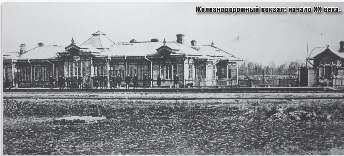
Железнодорожный вокзал: начало XX века.

Главный продукт вывоза – лен, который вместе с льняным семенем составляет немного меньше половины