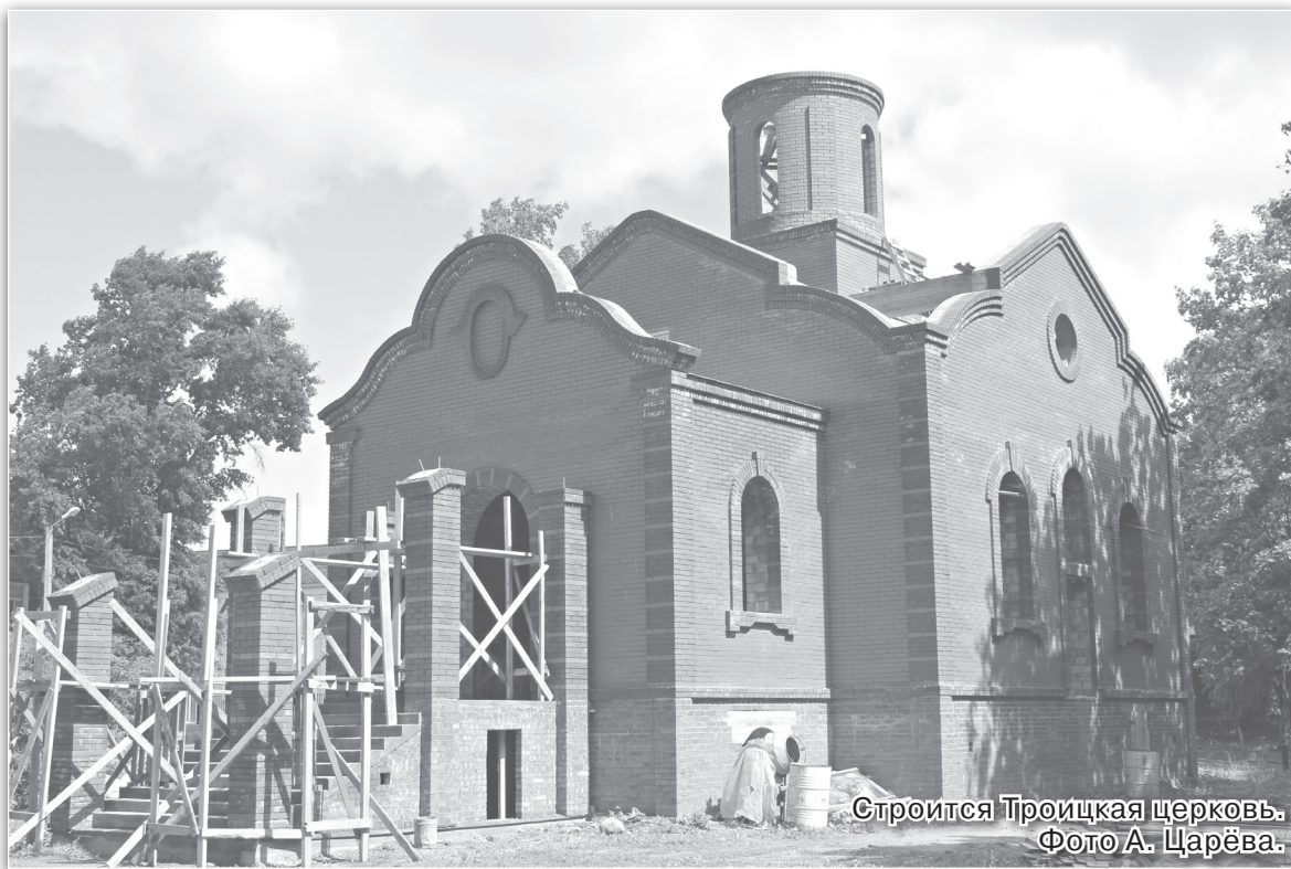
Строится Троицкая церковь.

профтехшкола, педагогические и технические курсы, 7 общеобразовательных школ.