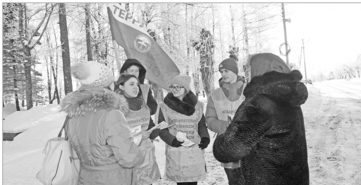
В муниципалитетах Тверской области прошла акция «Территория выборов». Волонтеры рассказывали избирателям о предстоящих выборах Президента РФ и приглашали принять в них участие

В-третьих, процедуру голосования постарались сделать максимально доступной для избирателей. В этом году отменены открепительные удостоверения, за которыми надо было обращаться в избирательную комиссию по месту прописки. Теперь все, кто находится далеко от места постоянной регистрации, могут проголосовать там, где удобно – подать соответствующее заявление можно было не только лично, но и