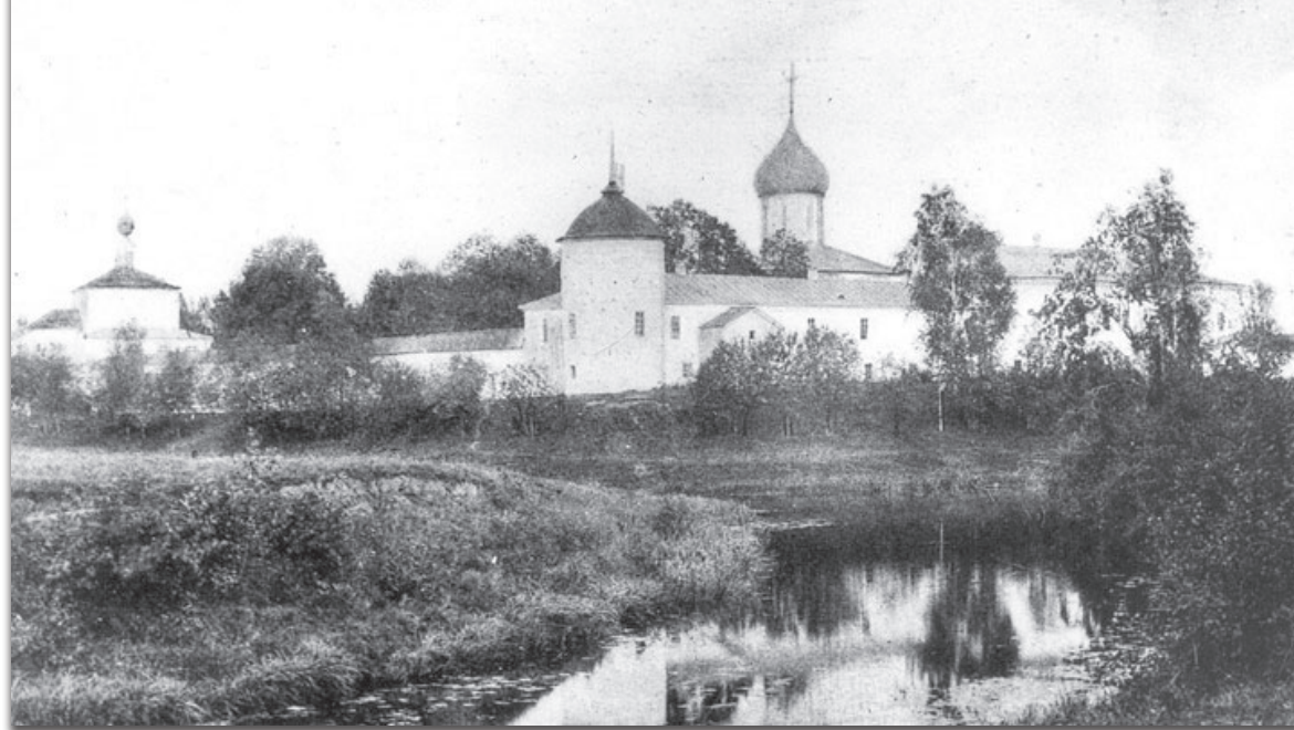
Красный Холмъ. Мужской Монастырь.