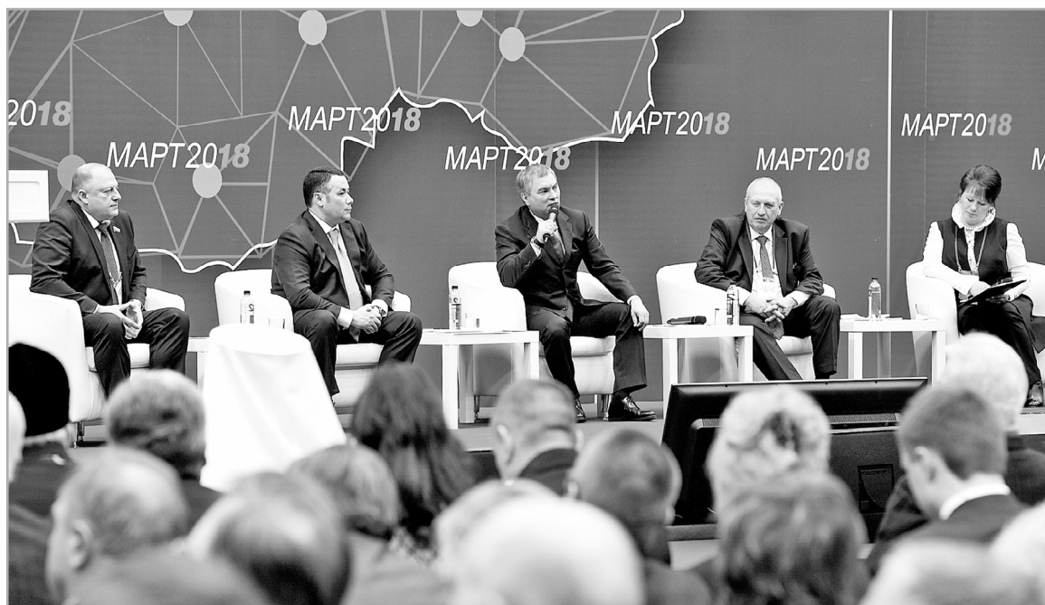
Форум муниципальных образований Тверской области «Верхневолжье, устремленное в будущее» собрал более 3,5 тысячи участников

В Тверской области вопросы реализации послания президента широко обсуждали на форуме муниципальных образований «Верхневолжье, устремленное в будущее». Он прошел 12 марта в Твери, в спорткомплексе «Юбилейный», и собрал более 3,5 тысячи участников со всего региона.