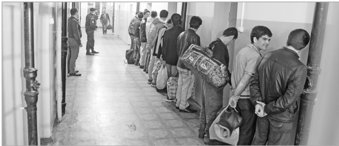
Для противодействия незаконной миграции правоохранительные органы регулярно проводят оперативно-профилактические мероприятия