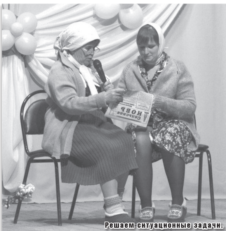
Решаем ситуационные задачи.