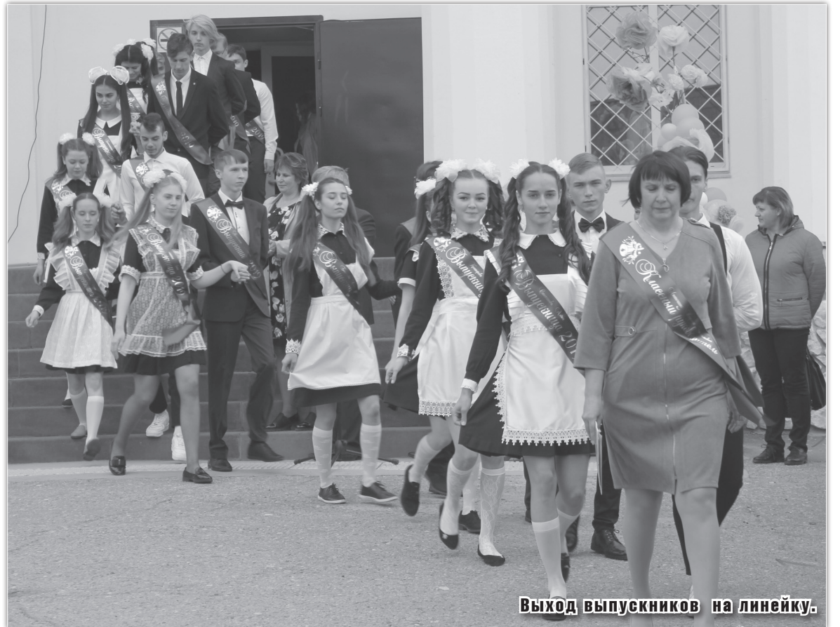
Выход выпускников на линейку.

Слово выпускникам. Видно, что ребята волнуются. Не обо- шлось без слез. Каждый один- надцатиклассник со словами благодарности вручил своему