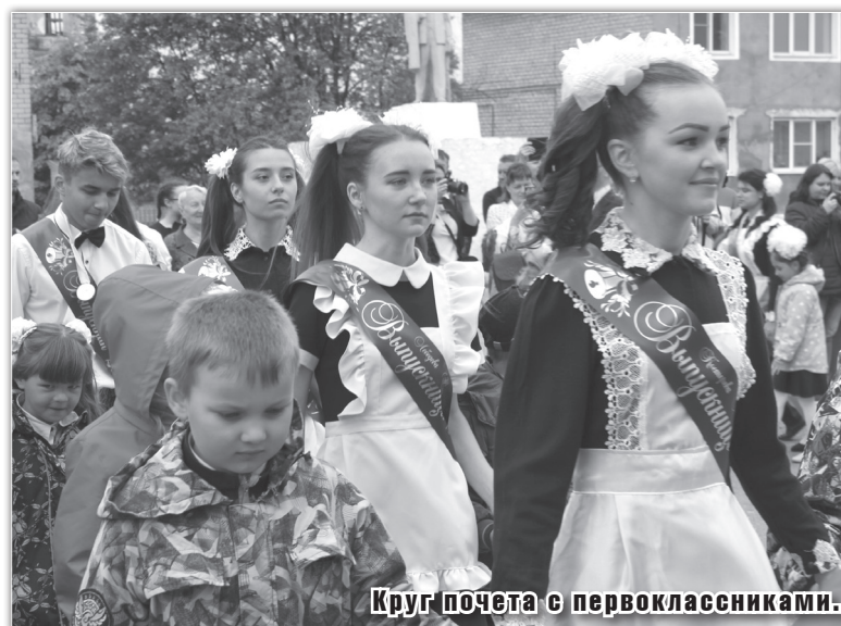
Круг почета с первоклассниками.