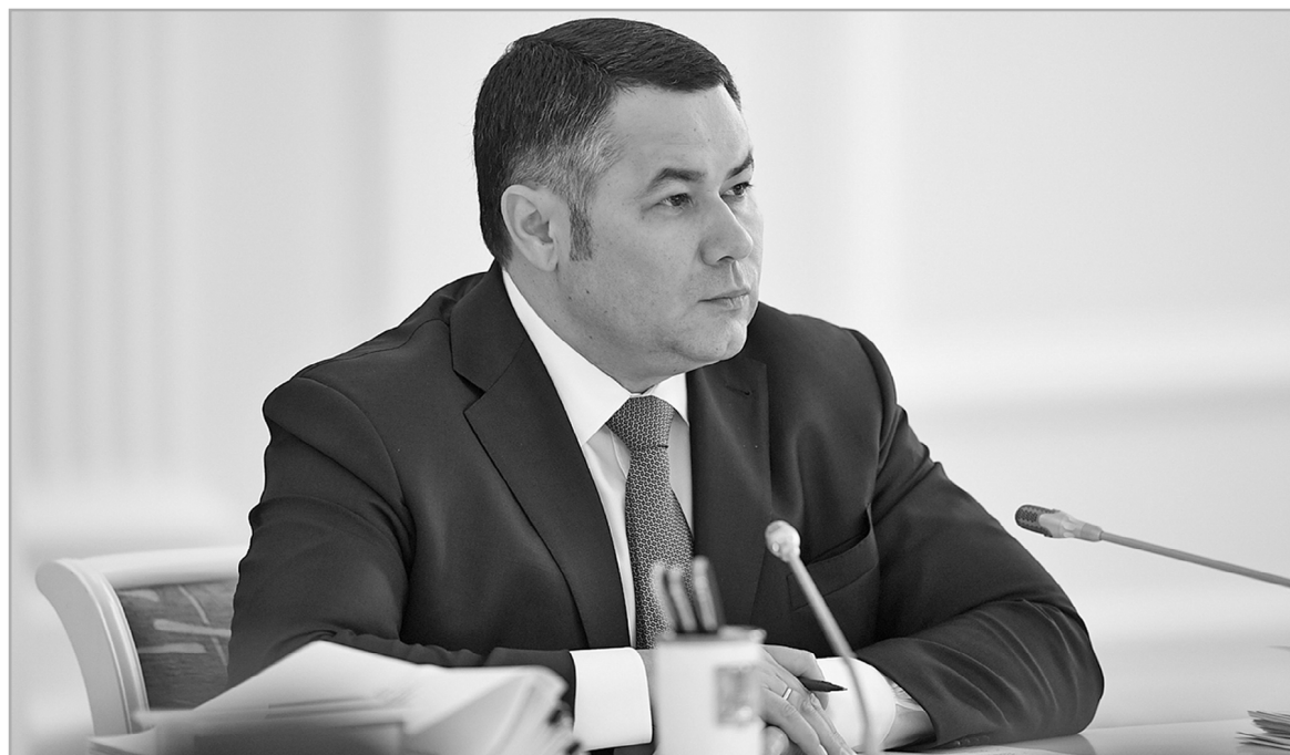
Игорь Руденя поставил задачу продолжить консолидацию активов в сфере теплоэнергетики

В прошлом году в Тверской области капитально отремонтировали и реконструировали 112 котельных, заменили 49