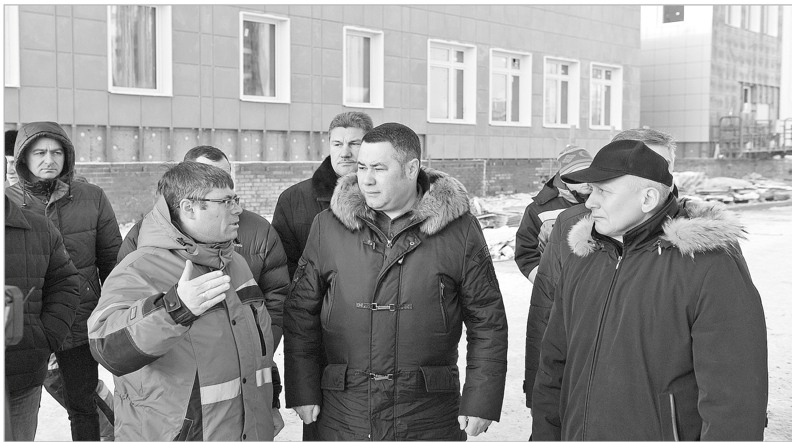
В течение трёх лет в регионе планируют построить как минимум 15 социальных объектов: детсады, школы, областную детскую больницу – все в рамках адресной инвестиционной программы

– Адресная инвестиционная программа Тверской области является ключевым инструментом бюджетного инвестирования, – считает губернатор Игорь Руденя. – В нее включены особо важные объекты, строительство которых обеспечивает решение задач в развитии экономики, инфраструкту-