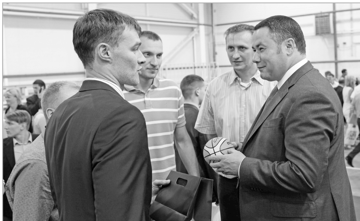
Губернатор Игорь Руденя считает, что жителям всех районов области необходимо обеспечить равные условия для занятий спортом

Здоровый образ жизни становится приоритетом для многих жителей области. Регулярно физкультурой и спортом занимаются 32% населения нашего региона, а в течение ближайших пяти лет эта цифра должна увеличиться до 40%. Значит, есть потребность в развитии имеющейся спортивной инфраструктуры на территории Верхневолжья. Реализацию на-