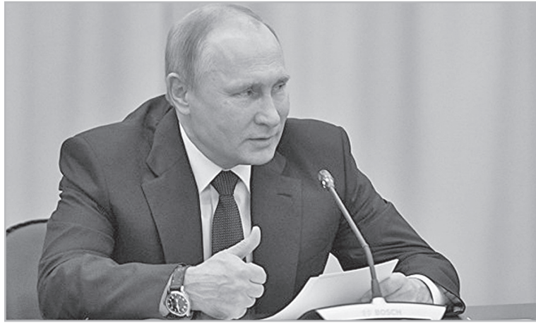
На международном культурном форуме в Санкт-Петербурге президент Владимир Путин заявил, что культура, искусство, просвещение – это ответ на вызовы варварства, нетерпимости, агрессивного радикализма, которые угрожают нашей цивилизации

– Фейк под названием «русское вмешательство», придуманный американцами для оправдания собственных проблем, прекрасно продается. Помимо США, его предлагают не только на Украине и в Прибалтике, но и во Франции и Германии, Великобритании и Испании. Да что там говорить, страны Европы, похоже, считают делом чести заявить о российском вмешательстве в свои дела.