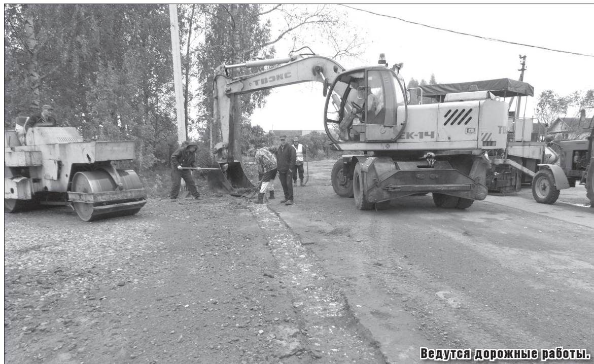
Ведутся дорожные работы.