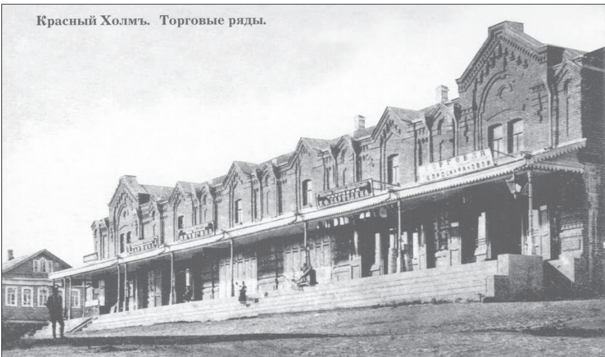
Красный Холмъ. Торговые ряды.

В период деятельности Л. А. Мясникова был построен кирпичный завод и налажено производство кирпича, из которых строили здания. В 1907 году в центре города были построены каменные торговые