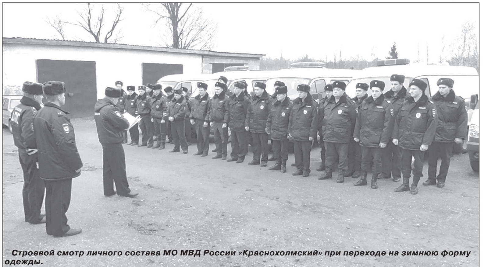
Строевой смотр личного состава МО МВД России «Краснохолмский» при переходе на зимнюю форму одежды.