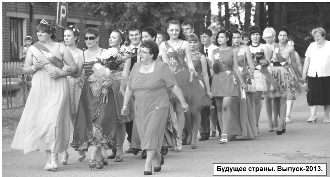
Будущее страны. Выпуск-2013.