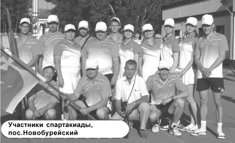
Участники спартакиады, пос.Новобурейский