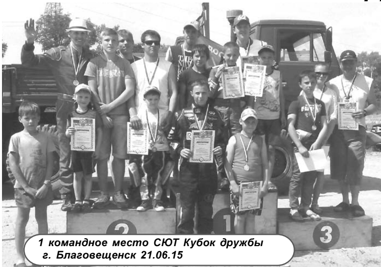
1 командное место СЮТ Кубок дружбы г. Благовещенск 21.06.15