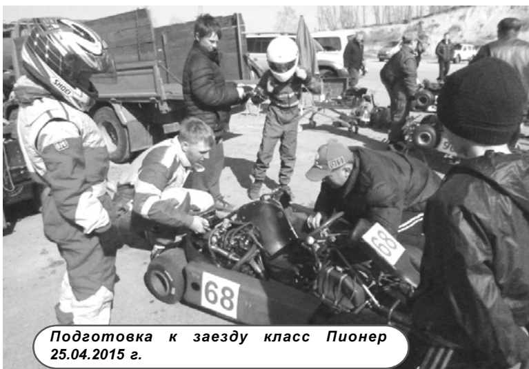
Подготовка к заезду класс Пионер 25.04.2015 г.