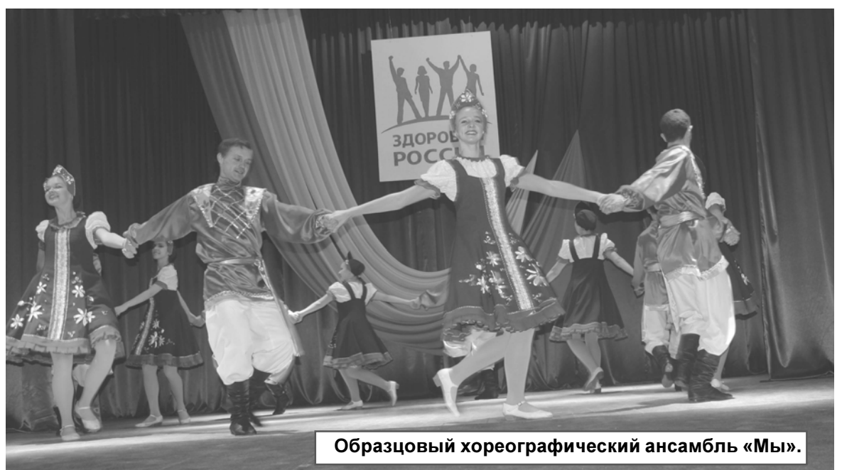
Образцовый хореографический ансамбль «Мы».