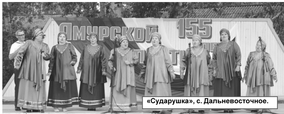
«Сударушка», с. Дальневосточное.