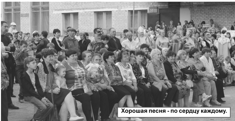
Хорошая песня - по сердцу каждому.