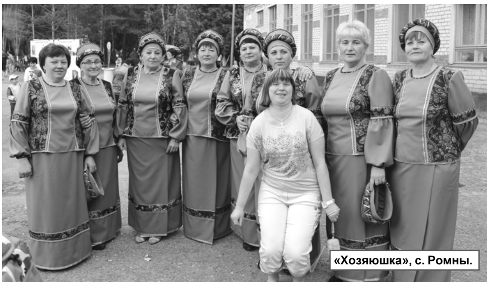
«Хозяюшка», с. Ромны.