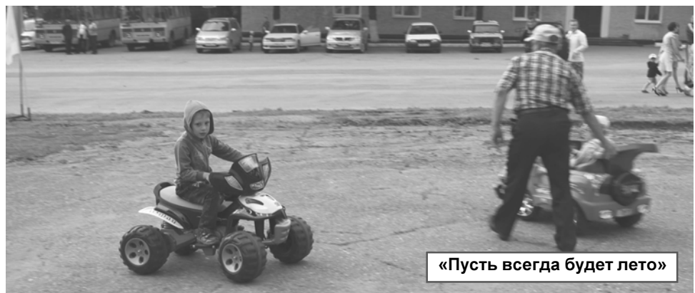
«Пусть всегда будет лето»