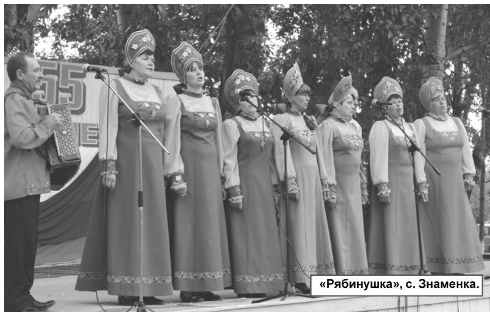
«Рябинушка», с. Знаменка.