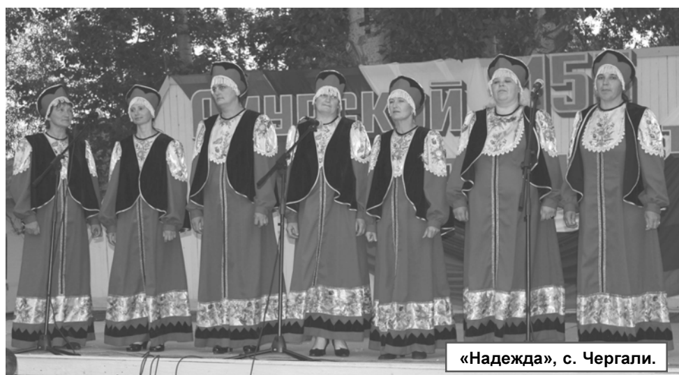
«Надежда», с. Чергали.