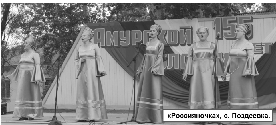
«Россияночка», с. Поздеевка.