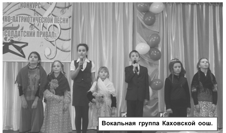
Вокальная группа Каховской оош.