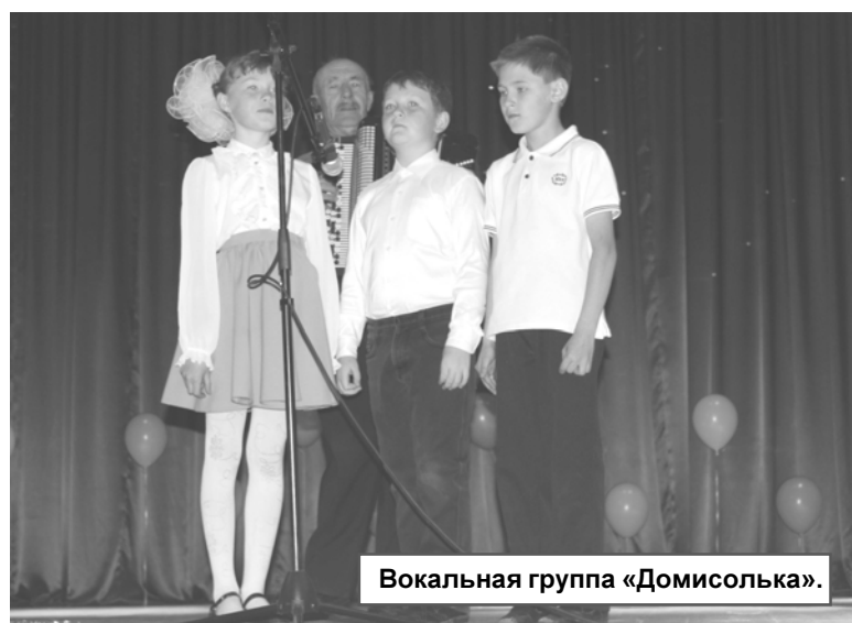
Вокальная группа «Домисолька».