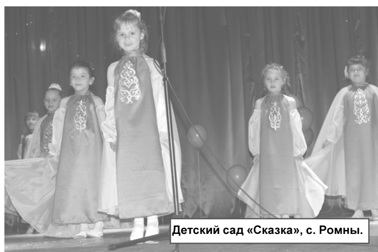
Детский сад «Сказка», с. Ромны.