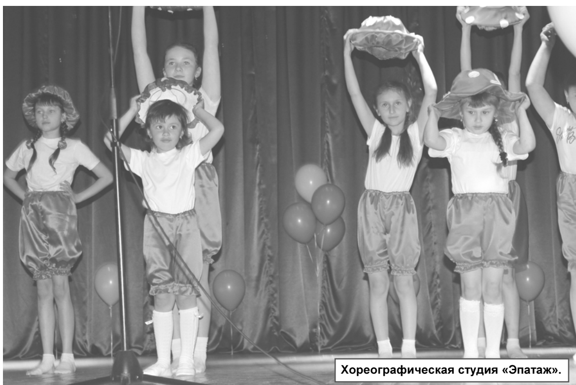
Хореографическая студия «Эпатаж».