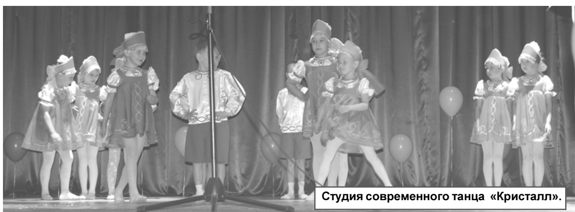
Студия современного танца «Кристалл».