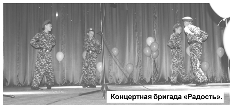
Концертная бригада «Радость».