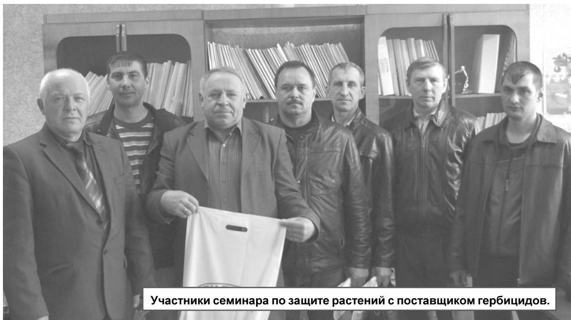
Участники семинара по защите растений с поставщиком гербицидов.

ВСЕ АПРЕЛЬ ПЕНСИОННЫЙ ФОНД, СКОРЕЕ ВСЕГО, ЕЩЕ НЕ БУДЕТ ПРИНИМАТЬ ЗАЯВЛЕНИЯ НА ВЫПЛАТУ 20 ТЫСЯЧ РУБЛЕЙ