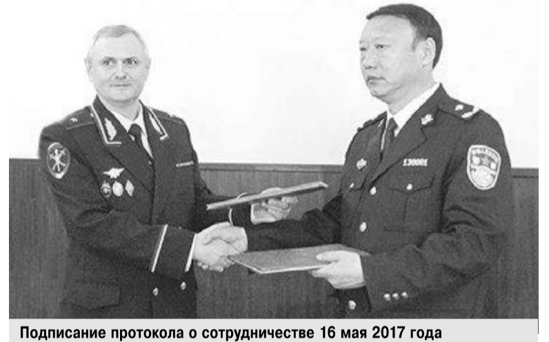
Подписание протокола о сотрудничестве 16 мая 2017 года

В 2019 году направлением НЦБ Интерпола УМВД России по Амурской области идентифицировано 23 транспортных средства. Установление первоначальных номеров АМТС позволило выявить 4 автомобиля, находящиеся в розыске по запросам других субъектов Российской Федерации.