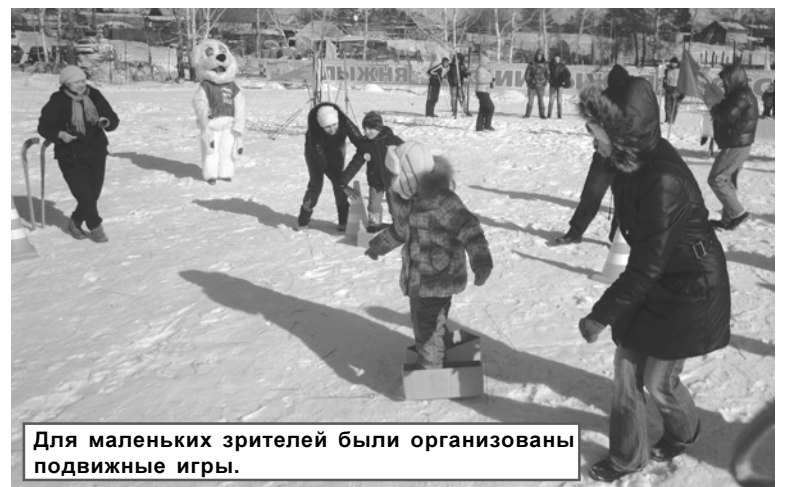
Для маленьких зрителей были организованы подвижные игры.