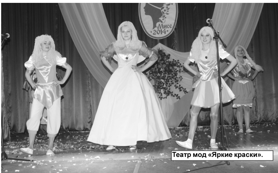
Театр мод «Яркие краски».