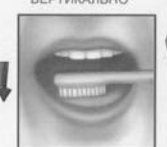
ОБЯЗАТЕЛЬНО ОЧИЩАЕМ ЯЗЫК ОТ БЕЛОГО НАЛЕТА ЗУБНОЙ ЩЕТКОЙ ИЛИ СПЕЦИАЛЬНЫМ СКРЕБКОМ