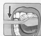
ВНЕШНЮЮ И ВНУТРЕННЮЮ ПОВЕРХНОСТЬ ВЕРХНИХ ЗУБОВ ЧИСТИМ СВЕРХУ НИЗ