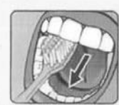
ПРИ ЧИСТКЕ ВНУТРЕННЕЙ ПОВЕРХНОСТИ ВЕРХНИХ ЗУБОВ ЩЕТКУ ДЕРЖИМ ВЕРТИКАЛЬНО