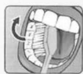
ВНЕШНЮЮ И ВНУТРЕННЮЮ ПОВЕРХНОСТЬ НИЖНИХ ЗУБОВ ЧИСТИМ СНИЗУ ВВЕРХ