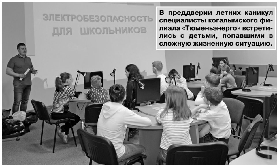
В преддверии летних каникул специалисты когалымского филиала «Тюменьэнерго» встретились с детьми, попавшими в сложную жизненную ситуацию.

Это особая категория юных граждан, работу с которыми ведут образовательные учреждения и социальные службы города. Встречу когалымские энергетики решили организовать в виде квест-игры на территории Музейно-выставочного центра. Места для игр трех команд школьников было достаточно. «Вооружившись» знаниями по электробезопасности и выбрав звучные названия своим командам, ребята двинулись проходить заготовленные энергетиками игровые этапы. На первом - участники разбирали пошаговое напряжение и учились правильно обходить лежащий на земле провод, используя индивидуальные