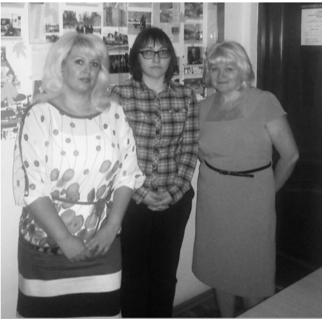
Ведущие специалисты архивного отдела

Наш архивный отдел - структурное подразделение Администрации города Когалыма - выступает в разных ипостасях: это и орган управления архивным делом, и хранилище документальной памяти, выполняющее также важные социальные, культурно-просветительские и воспитательные