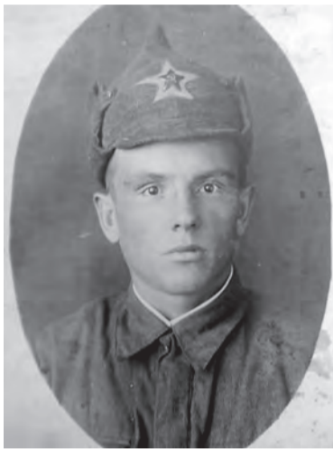
Только тот народ, который чтит своих героев, может считаться великим. (К. К. Рокоссовский)