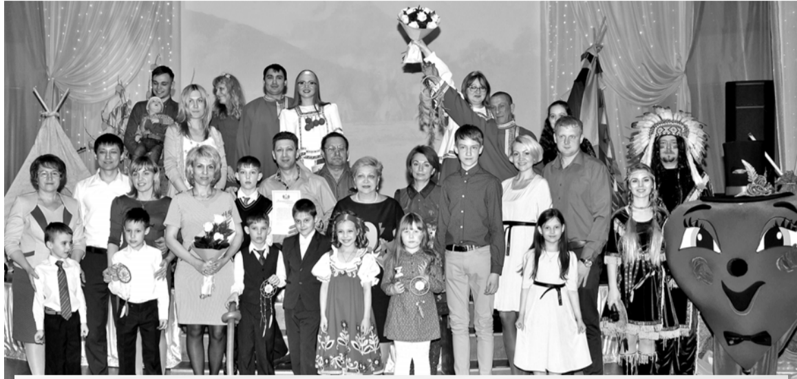
9 апреля в молодежном центре «Метро» прошел юбилейный, пятый, городской фестиваль семейного творчества, где горожане выбрали семью, которая будет представлять Когалым на региональном этапе фестиваля «Покорение без границ». Праздник прошел ярко и интересно под тематическим названием «Тропа жизни» - в духе индейцев Дикого Запада.

Как только гостям фестиваля было объявлено, что пора начинать семейный праздник и погрузиться во всеобщую атмосферу веселья, умиротворенно дремлющую индейскую долину захватили шумные ковбой-аниматоры, наполнив праздник веселым управляемым карнавальным хаосом. Естественно, что генераторами энергии праздника сразу стали дети, которые ликовали от восторга. Шоу мыльных пузырей, бесконечное количество шаров, игр и веселых конкурсов, ковбойские танцы и индейские пляски... В такой праздничной суматохе прошла ярмарка блюд, где каждый мог оценить