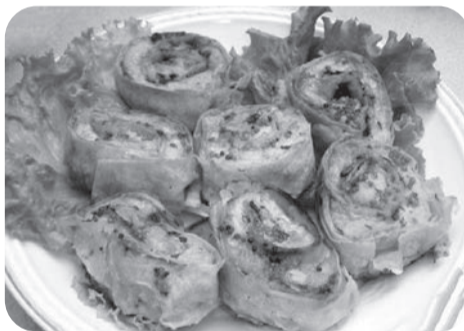
Запеченные рулеты из семги в лаваше

Ингредиенты: филе семги - 1 кг; лаваш армянский тонкий - 2 листа; сыр твердый (полутвердый) - 150-200 г; зелень укропа и петрушки - половина пучка; лимонный сок - 2-3 ст. л.; оливковое масло - 5-6 ст. л.; соль - по вкусу; перец черный молотый - по вкусу; горчица зернистая - 1 ст. л.; травы сухие (например, базилик) - 1-2 ч. л.