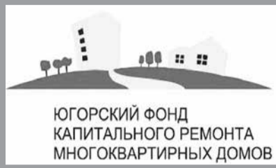
ЮГОРСКИЙ ФОНД КАПИТАЛЬНОГО РЕМОНТА МНОГОКВАРТИРНЫХ ДОМОВ

В начале мая жители Когалыма уже должны будут получить отдельные квитанции на оплату взносов за капремонт их домов за апрель по лицевым счетам, присвоенным Югорским фондом. Всем жителям города начисления будет осуществлять непосредственно Югорский фонд капитального ремонта. Ранее это делал ООО «ЕРИЦ».