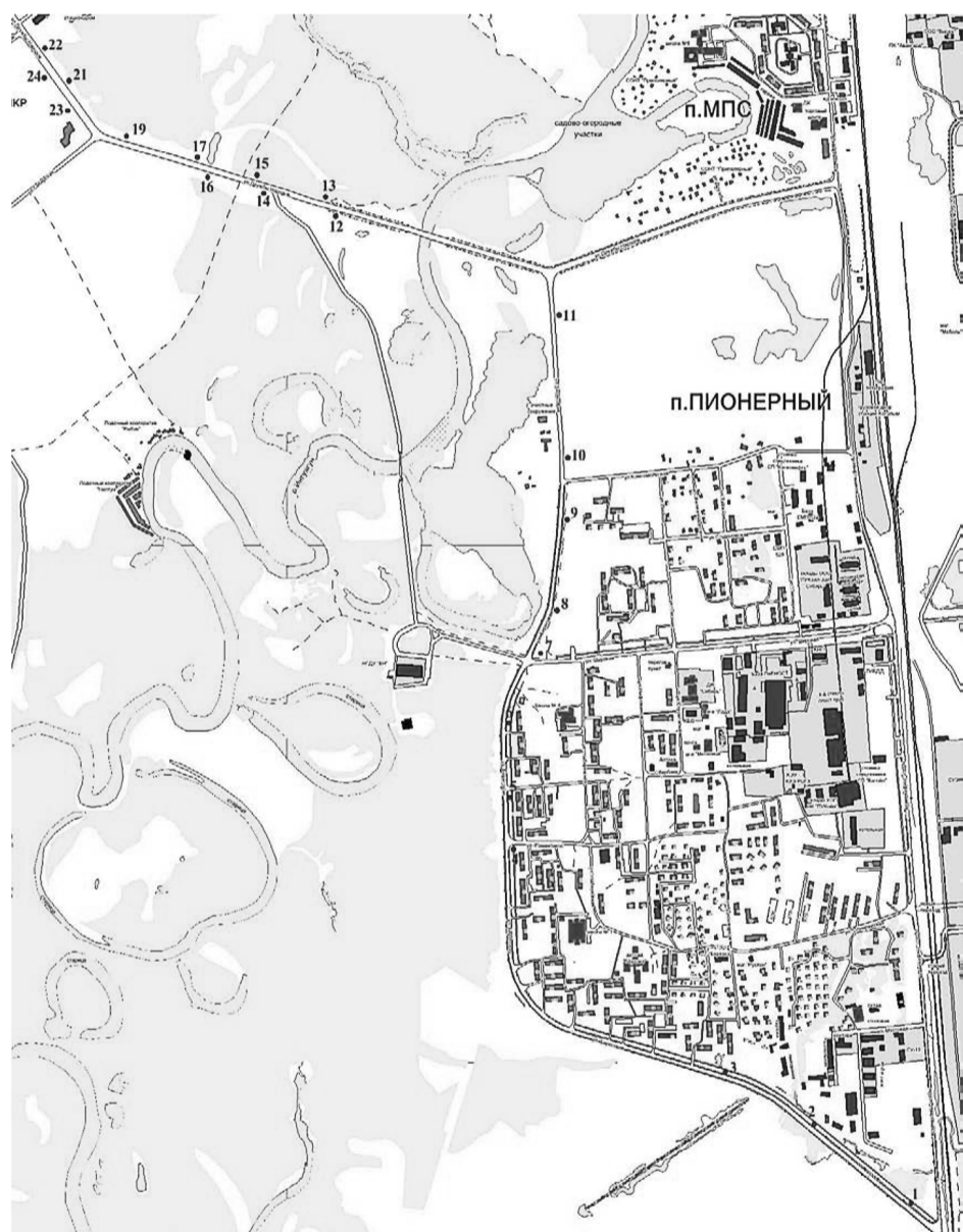
Приложение 4 к постановлению Администрации города Когальма от 13.04.2017 №739