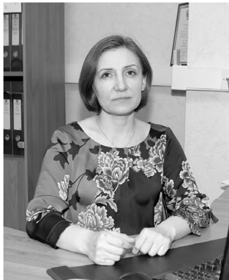
- Елена Валерьевна, 1 января 2016 года изменилась схема расчетов налогов, относящихся к недвижимости. В чем заключаются эти изменения, и как этот вопрос касается когалымчан, в частности?

- С 2015 года вступила в силу новая глава 32 Налогового кодекса Российской Федерации, посвященная налогу на имущество физических лиц. Она предусматривает возможность расчета налога исходя из кадастровой стоимости недвижимости. Налог считается индивидуально по каждому объекту недвижимости, причем для жилых помещений можно применить налоговый вычет. Но для того чтобы все новшества в налогообложении применялись в конкретном регионе, его власти должны были принять закон о переходе на расчет налога на имущество физических лиц исходя из кадастровой стоимости. Таким документом для Когалыма стало решение Думы города Когалыма от 30.10.2014 № 472-ГД «О налоге на имущество физических лиц».