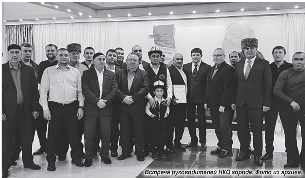
Встреча руководителей НКО города.

деньги нашей национально-культурной организацией и закупали продукты, готовили еду, чтобы помочь и оказать поддержку врачам.