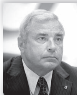
Юрий Важенин, член Совета Федерации от Югры:

«Несмотря на все возможные трудности объективного и субъективного характера красной нитью проходит мысль: Как жить, причем хорошо жить, дальше! На чем надо сосредоточить «направление главного удара» - это, в первую очередь, привлечение инвестиций, обеспечивающих выход экономики на новый уровень развития. Проблем и задач, которые требуется решить, - огромное количество, но все трудности преодолимы или при равнодушном отношении к делу всей команды Губернатора при поддержке всех жителей округа».