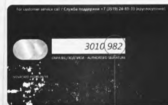
последние три цифры - код безопасности CVV/CVC

УМВД РОССИИ ПО ХМАО - ЮГРЕ ПРЕДУПРЕЖДАЕТ БУДЬТЕ БДИТЕЛЬНЫ!