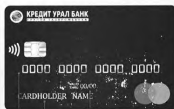
номер карты | владелец карты | срок действия