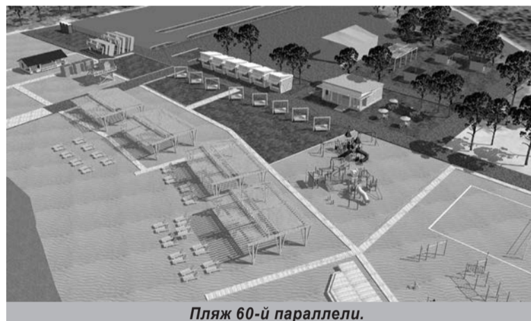
Пляж 60-й параллели.

В результате они получили асфальтированный двор, тротуары, новое освещение, увеличение парковочных мест, детские игровые комплексы, спортивную площадку. Словом, сегодня этот двор можно назвать одним из показательных, как в плане благоустройства, так и в плане