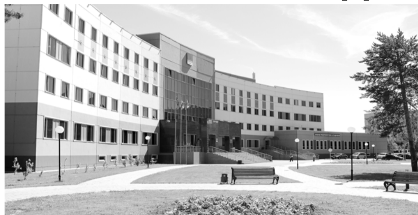
7 октября в Когалыме состоялось заседание Общественного совета по реализации Стратегии социально-экономического развития города Когалыма до 2020 года и на период до 2030 года при главе города Когалыма. На заседании были рассмотрены вопросы содействия занятости населения, социально-экономического развития города и информация об исполнении протокольных решений Общественного совета.