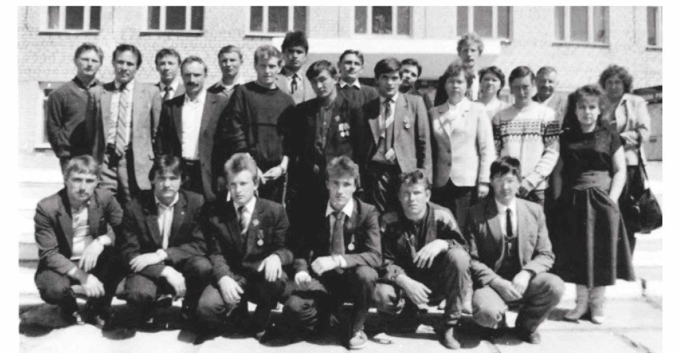
Первый слёт воинов-афганцев. 1986 год.

Подготовила Юлия Савватеева.