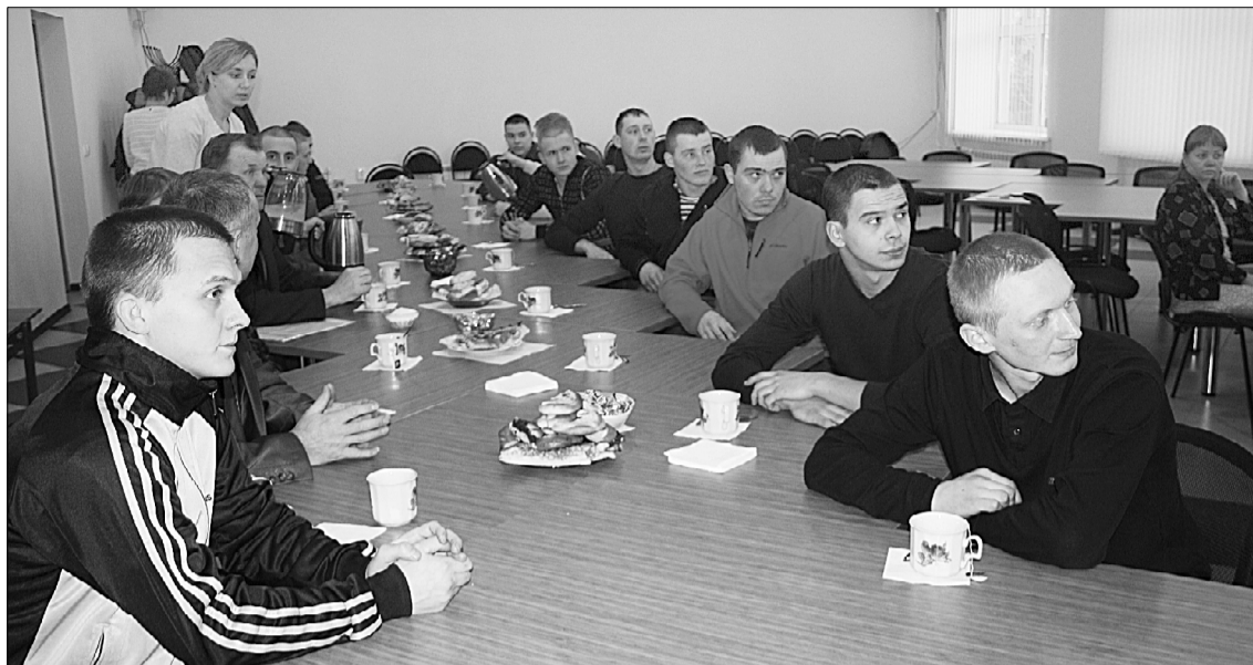
Главные герои встречи.