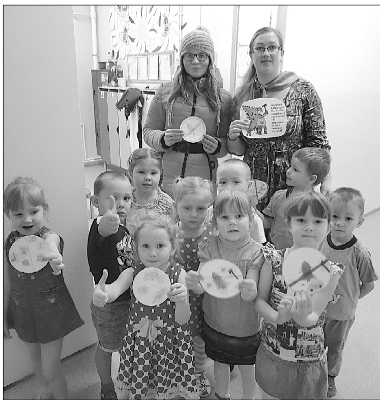
Юные экологи ДОУ №9 с запрещающими знаками «Не руби ель!».

В среду переживали за судьбу маленькой елочки из произведения Г.Х. Андерсена «Ель», заучивали наизусть стихотворение «Мне елку купили» Ирины Токмаковой. В четверг украшали искусственную елку в уголке природы, рисовали плакаты «Сохраним елочку!», которые вывесили на входные двери