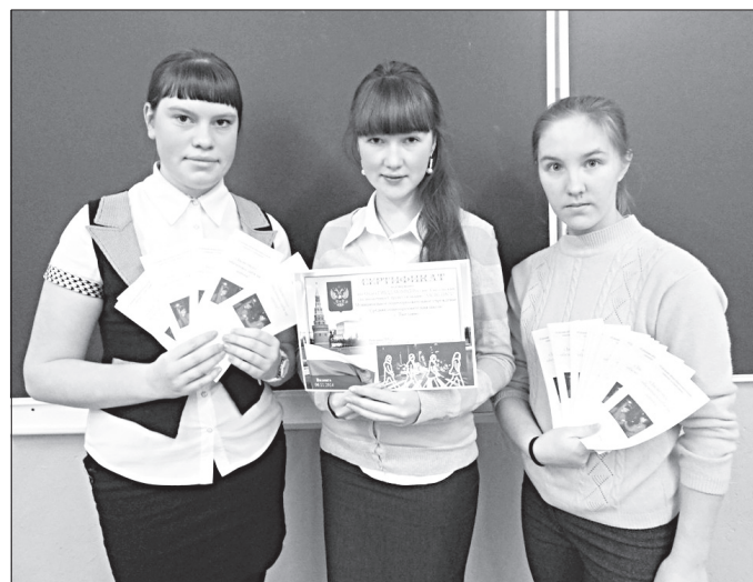
Участники школы актива.

Так, среди учащихся Заозерской школы был объявлен конкурс на лучший светоотражающий знак. На совете детского объединения «Милосердие» выбрали более приемлемый и менее затратный вариант - значки, которые можно крепить к любой одежде или ранцу. Авторами проекта стали де-