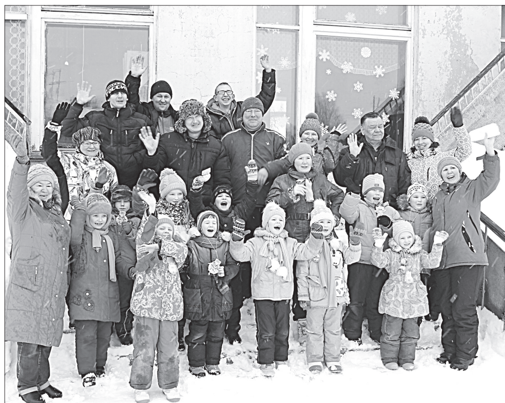
Участники «Зимних Олимпийских игр».

Завершились соревнования церемонией награждения и праздничным чаепитием, где ребята и их родители делились своими эмоциями и впечатлениями о прошедшем мероприятии.