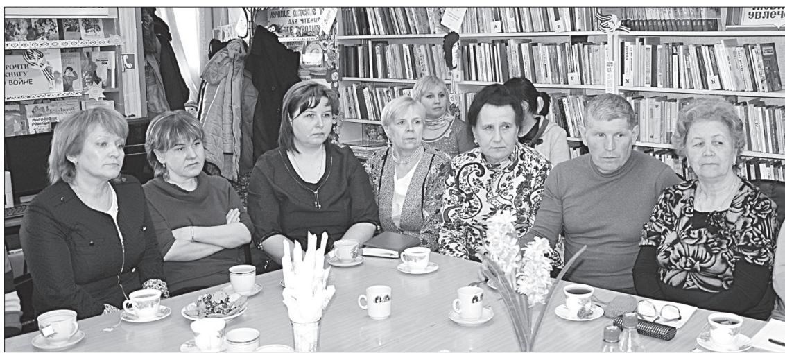
На встрече с представителями общественности куратовского куста.

С данной ситуацией спикер знаком давно и уже не раз сталкивался, неоднократно эта тема обсуждалась в прави-