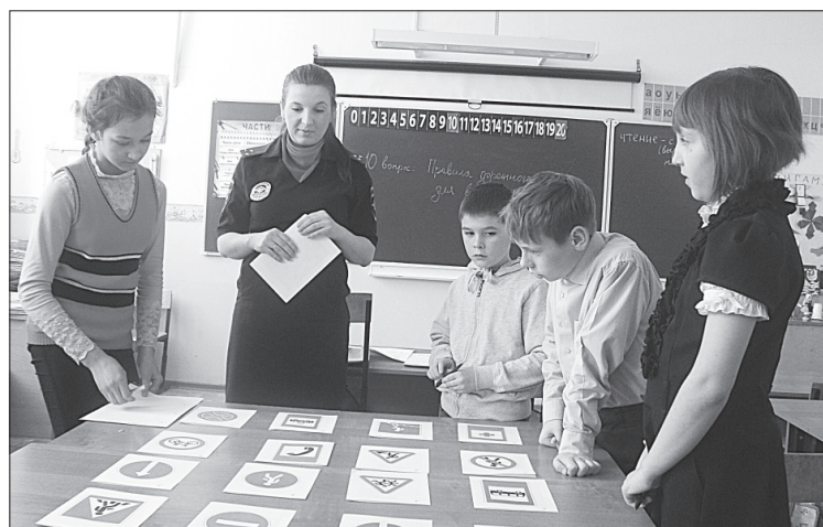
Теоретический этап конкурса.

Во втором этапе конкурса ребятам предстоит пройти два практических испытания - вождение велосипеда в автогородке и фигурное вождение велосипеда. Командным испы-