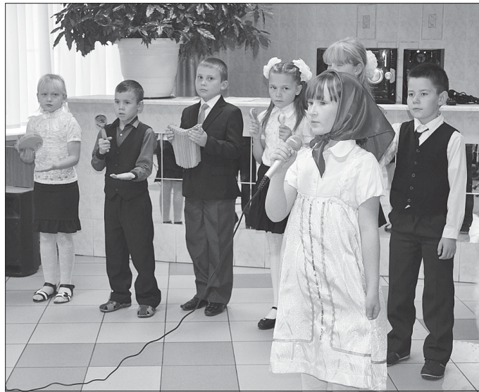
Выступление юных артистов.