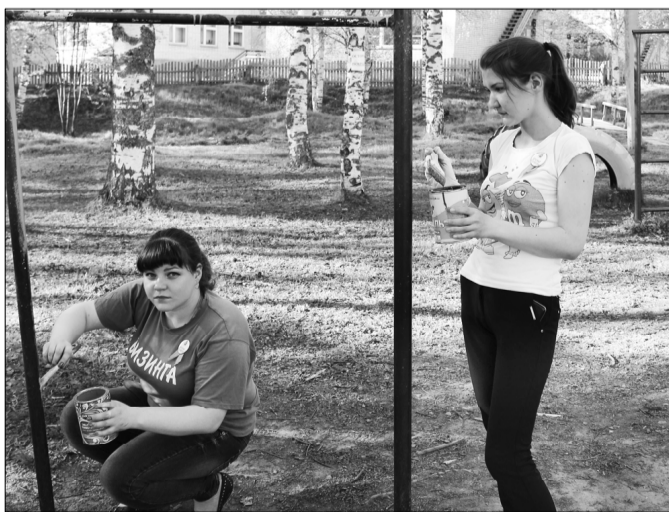
Участники субботника в парке.

Накануне студенты, проживающие в общежитии, подготовили участникам эмблемы для бейсболок и броши с логотипом субботника.