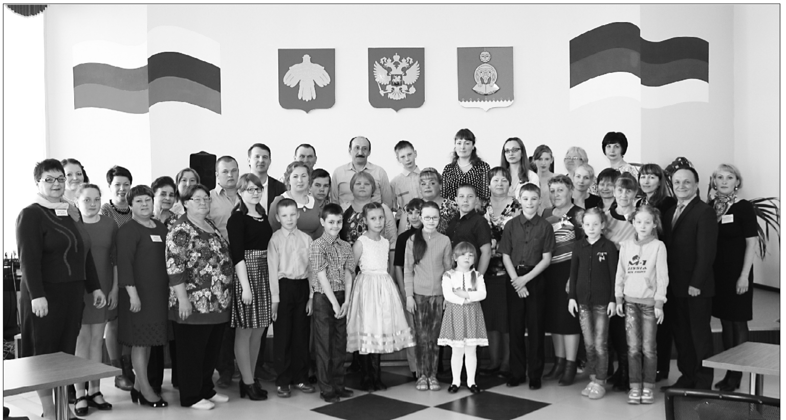
Участники зонального слёта замещающих семей.

Приёмных родителей интересовали проблемы детского подросткового возраста и их решение, летний отдых и трудоустройство, дальнейшее обучение детей, имеющих отклонения в развитии, в связи с закрытием коррекционных групп во многих учреждениях профессионального образования в Республике Коми, обеспечение сирот жильём и многое другое. Кроме того, приёмные родители поделились