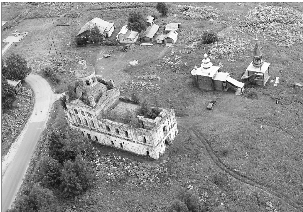
Вотчинская церковь с высоты птичьего полета.

Внизу орнамент, олицетворяющий принадлежность к коми культуре, уважение к истории, почитание предков. Значение