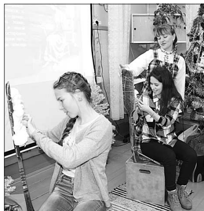
Прясль на прялке непросто.

Не без интереса дети принимали участие в музыкальном конкурсе «Угадай новогоднюю мелодию и спой караоке». Здесь уж артистам пришлось постараться, не только петь, но и одновременно вы-