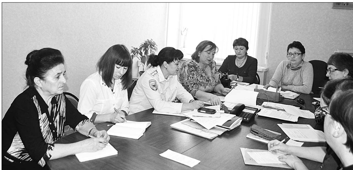
Заседание комиссии по делам несовершеннолетних.