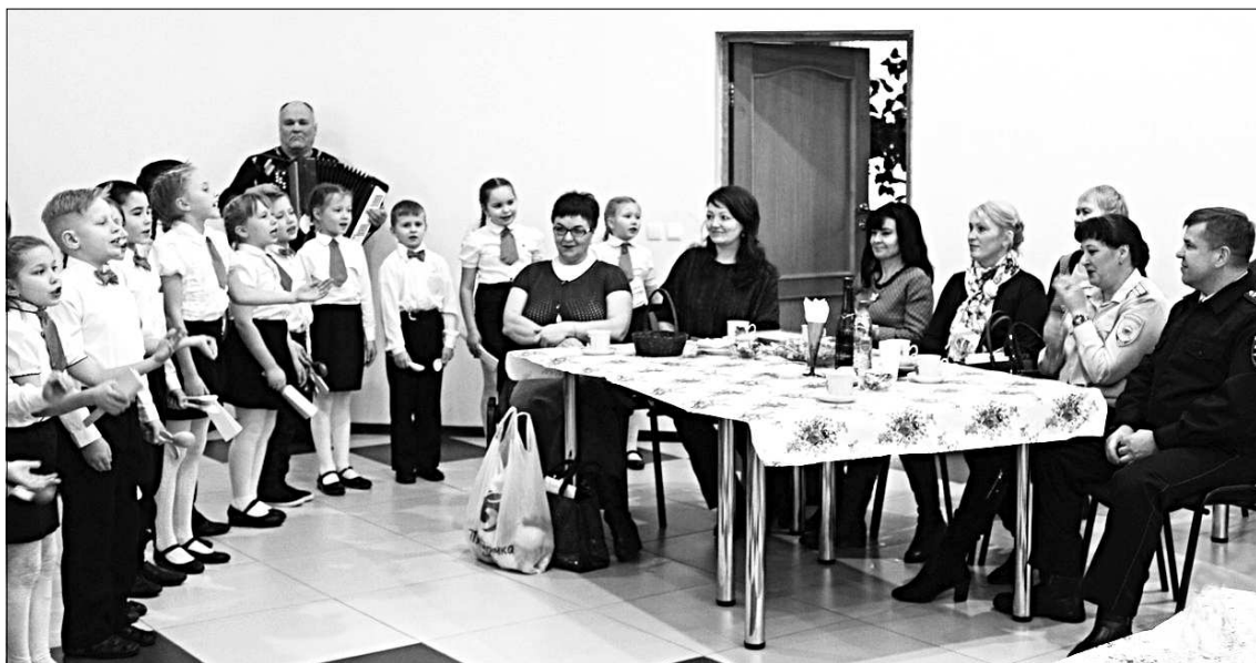
На торжественном мероприятии, посвященном 100-летию КПДН.