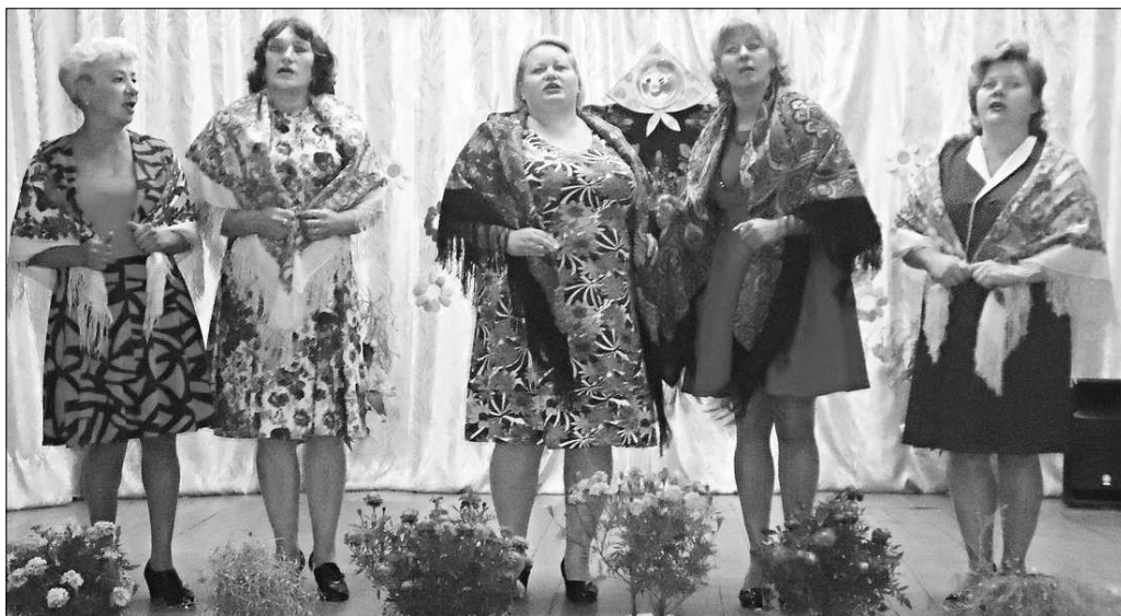
Вокальная группа «Веселушка».