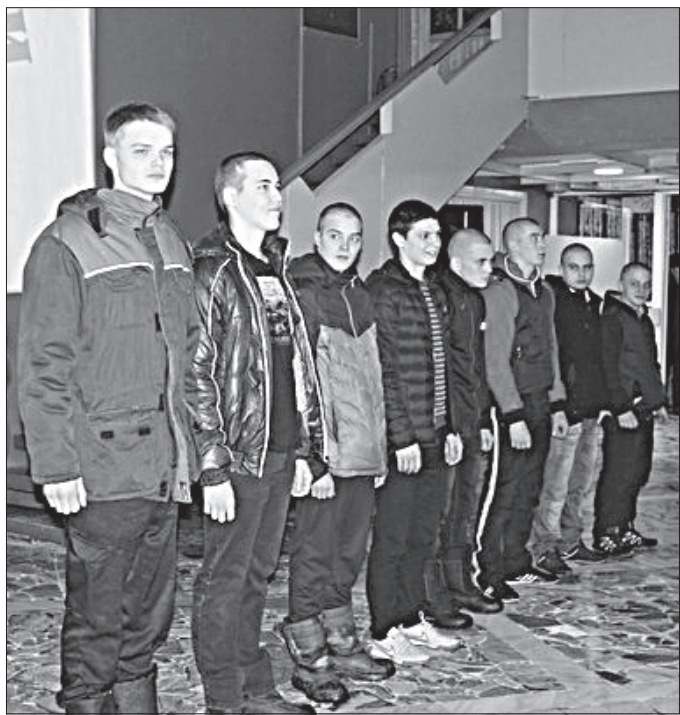
Призывники перед отправкой.

13 ДЕКАБРЯ состоялась очередная отправка призывников на республиканский сборный пункт в г. Емва.