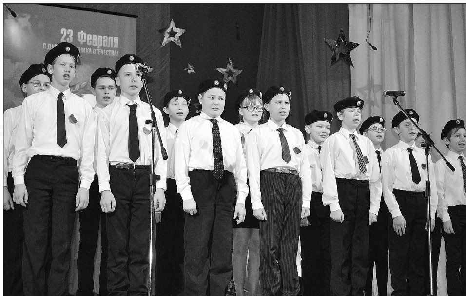
Кадеты Визиндорской школы.