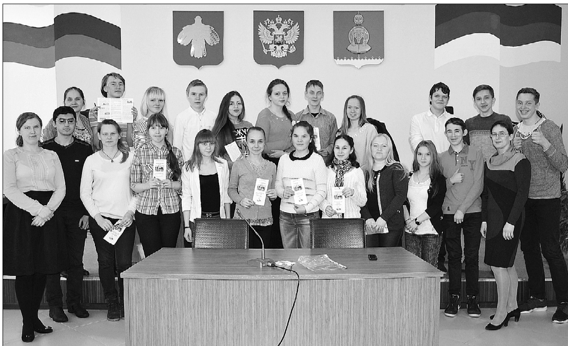
Десятиклассники в гостях у Территориальной избирательной комиссии.